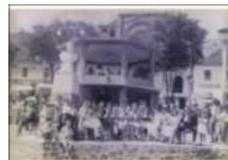
Municipio de BETULIA - ANTIOQUIA